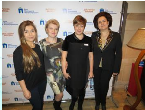
Пресс-служба Гильдии риэлторов Московской области

Всем членам ГРМО банк присвоил статус «Золотого партнёра» до 30 июня 2015 года. Вечер закончился прекрасным джазовым концертом!