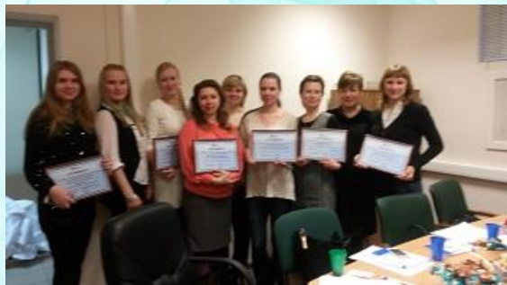
Банк Жилищного Финансирования

Новые программы кредитования «на бизнес/новостройку» (залоговые кредиты как доступная альтернатива кредитам МСБ и крупным потребкредитам)