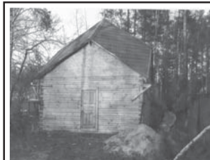
Орехово-Зуевский р-н, д. Большая Дубна, кооп. «Старт-2»

Дом 6х6, брус 20 см, 2 этаж зимний, участок 7 сот., газ подведен, цена