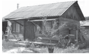
Ногинский район / д. Пешково, снт Полянка 1 эт. дача, брус, свет, колодец, хоз блок, з/у-5 соток.

(495)971-00-16, 8-926-116-77-23. 1 050 000 р.