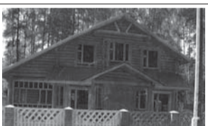
Орехово-Зуевский р-н, д. Большая Дубна, кооп. «Старт-2»

(495)971-00-16, 8-910-401-51-84. 1 200 000 р.