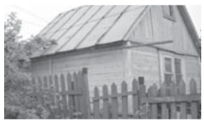
Ногинск/ Красный Электрик, снт Березка

1 эт. дача, дерев., свет, колодец, з/у-7,28 соток.