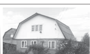
Электроугли / СНТ «Нарцисс» 1 эт. домик / кирпич, оп 42 кв. м., с мансардой, кухня, 2 комнаты, з/у - 6 сот., ухоженный, свет, колодец, летний душ.

972-43-64, 8 (985) 789-59-54 1 750 000 р.