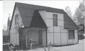
Электроугли / СНТ «Заря»

(495)971-00-16, 8-926-116-77-23. 650 000 р.