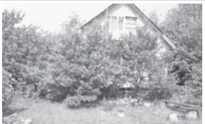
Ногинский район / д. Кудиново, снт Мичуринский труженик 2 эт. дача, каркасно-щит., свет, колодец, печь, з/у-5 соток.

(495)971-00-16, 8-926-116-77-23. 1 050 000 р.