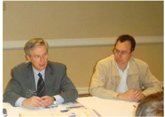
Представители Гильдии риэлторов Московской области в составе делегации РГР в гостях у Национальной Ассоциации Риэлторов США

Это уже не первая поездка на Конгресс США. Рынок недвижимости соединенных штатов формировался годами, ему уже более 100 лет. Российский рынок значительно моложе – чуть более 20 лет, и ему есть чему поучиться у запада. Опыт риэлторов, работающих в Америке, важен для нас – это сформировавшаяся картина цивилизованного рынка недвижимости, к которому мы стремимся. С целью знакомства со спецификой работы риэлторов различных городов США, Национальный Конгресс НАР проводится каждый раз в различных штатах.