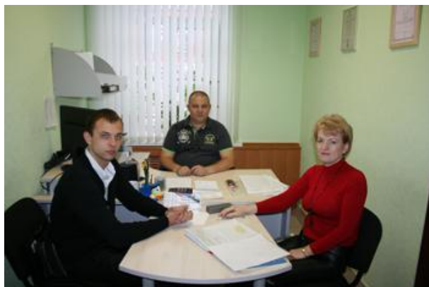
На фото слева – направо: