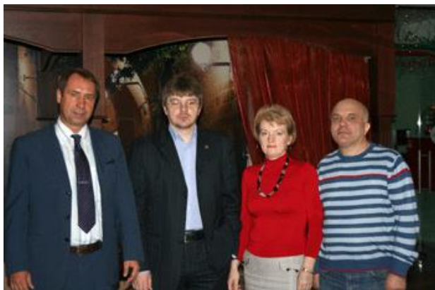
На фото слева - направо: