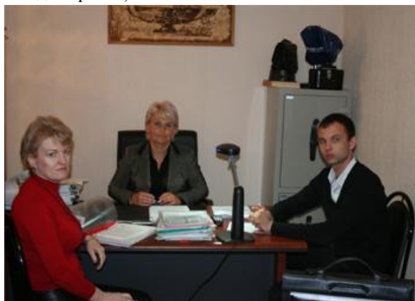
На фото слева – направо: