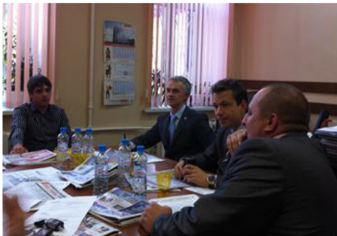
В мероприятии приняли участие руководители агентств, входящих в Электростальскую гильдию риэлторов