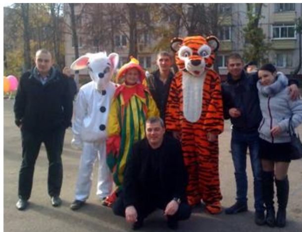
Коллектив Агентства недвижимости "Первое решение" (г.Домодедово)