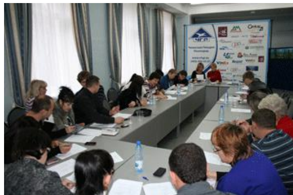
Аттестация специалистов ЧГР